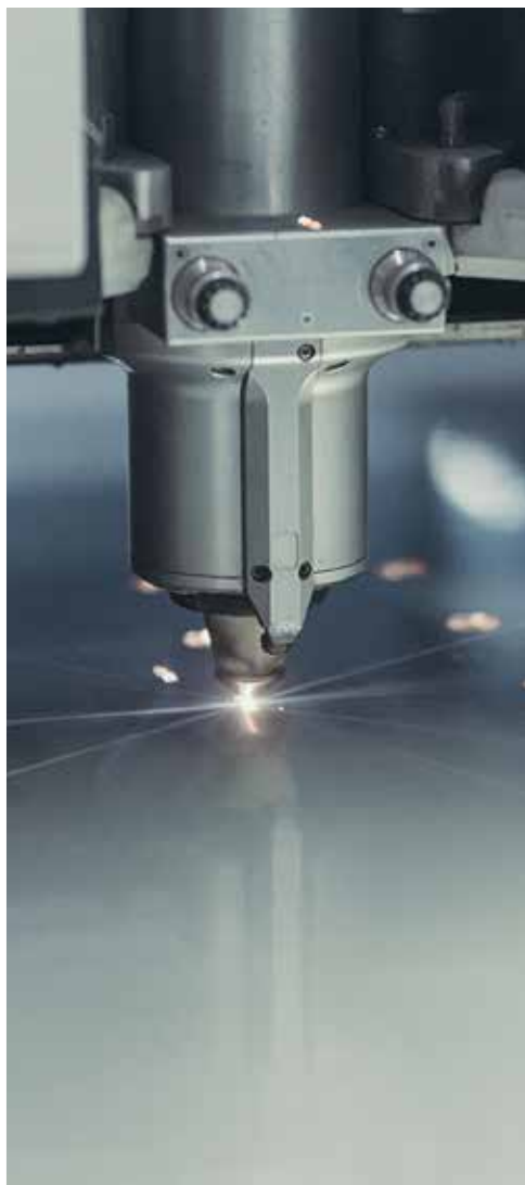
LASERN & STANZEN