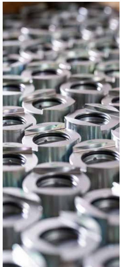
DREHEN & FRÄSEN